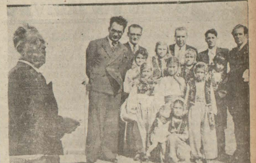
Hatayın ilk kurtuluş yıldönümünün nasıl kutulduğunu yazmıştık. Yukarıdaki resimler Hatay Vallsi Sökmenşüeri nutuk söylöerken ve Hataylı çocukları milli kıyafetlerle göstermektedir.